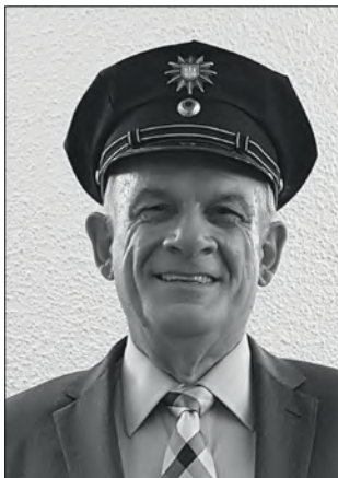
Peter Hahne TV-Moderator und Bestseller- Autor, Ehrenkommissar der Bayerischen Polizei und der Christlichen Polizeivereinigung

L iebe Leserinnen und Leser, es ist rund 60 Jahre her, da kamen uniformierte Polizisten zu uns in die Grundschule. „Verkehrserziehung“ nannte sich das. Aber es war viel mehr: Wir bestaunten die „Bewaffnung“ der Beamten und die Dienstwagen, die draußen mit Blaulicht und Martinshorn auf dem Schulhof standen. Wir erfuhren nicht nur, wie man eine Straße überquert oder Gefahren richtig einschätzt. Viel mehr! Wir lernten Respekt und Hochachtung vor einem Beruf, in dem der Beamte damals wie selbstverständlich „Schutzmann“ hieß. Der Polizist war der Freund und Helfer. Das ging in Fleisch und Blut über: Ein Uniformierter war immer für uns da und meinte es gut. Und deshalb zollte man ihm Anerkennung.